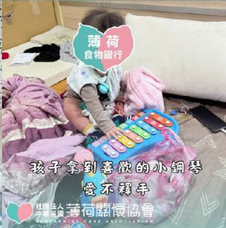
薄荷 食物銀行 孩子拿到喜歡的小鋼琴 愛不釋手

社團法人 中華民國 薄荷關懷協會 PEPPERMINT CARE ASSOCIATION