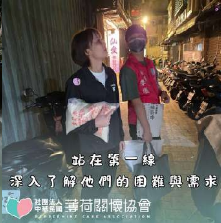
站在第一線 深入了解他們的困難與需求

社團法人 中華民國 薄荷關懷協會 PEPPERMINT CARE ASSOCIATION