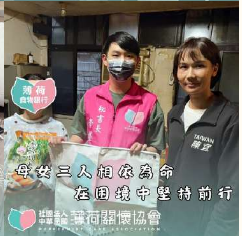
薄荷 食物銀行 母女三人相依為命 在困境中堅持前行

社團法人 中華民國 薄荷關懷協會 PEPPERMINT CARE ASSOCIATION