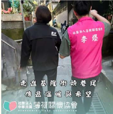
走進基隆街頭巷尾 傳遞溫暖與希望

社團法人 中華民國 薄荷關懷協會 PEPPERMINT CARE ASSOCIATION