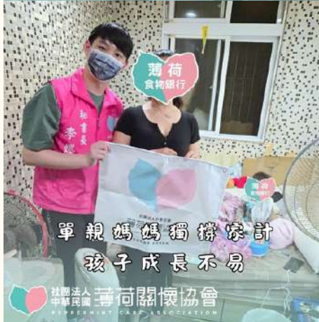
薄荷 食物銀行 單親媽媽獨撐家計 孩子成長不易

社團法人 中華民國 薄荷關懷協會 PEPPERMINT CARE ASSOCIATION