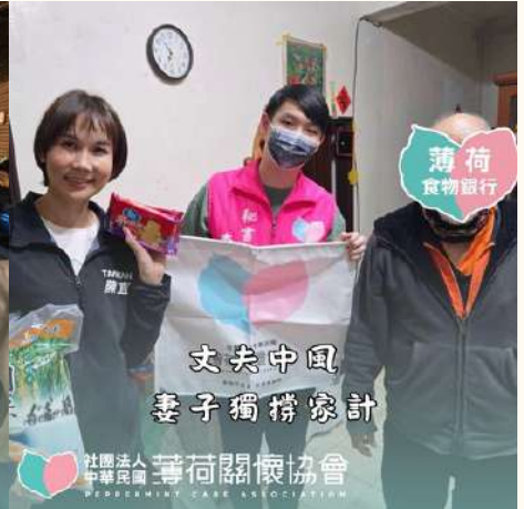
薄荷 食物銀行 丈夫中風 妻子獨撐家計

社團法人 中華民國 薄荷關懷協會 PEPPERMINT CARE ASSOCIATION